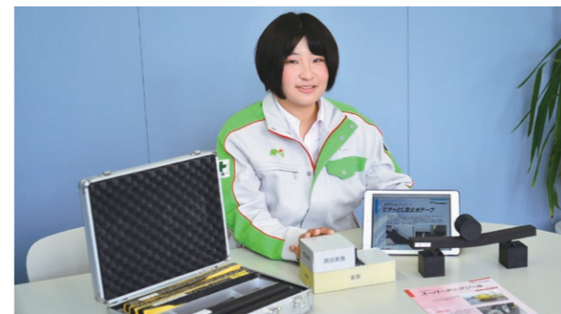
いつも持ち歩いている製品の模型やタブレットなどの営業ツール