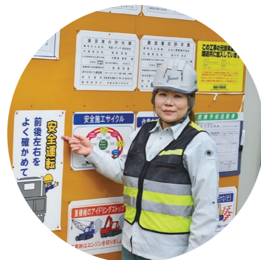
安全確保は現場監督の最も重要な役目

自分が直接担当していない現場でも、その姿勢は変わりません。先輩監督が担当する道路舗装補修の現場でも、工区内を巡回しながら作業員に「気を付けてね」と声をかけ、コミュニケーションを図ります。時には、みずから測量機器と三脚を担いで現場の端に立ち、ロードローラーで押し固められた路面の仕上げり具合を検測。そして、ほかの現場監督とも連携しながら各工程の進捗具合を確かめて回ります。