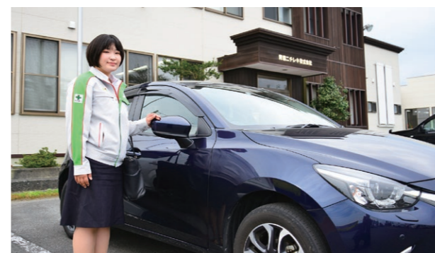
担当エリアへの営業は車で移動。常に安全運転を心がけています